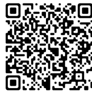
訂購茶葉 QR CODE

由 2024 年 5 月 30 日至 6 月 5 日收到奉獻芳名及中國銀行 5 月份奉獻，請向同工查詢。