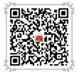
報名 QR code

招募：帶詩歌，做手工，帶遊戲，電腦操作，預備茶點等等的事奉人員。有感動事奉的可聯絡蓮芝或謙謙。