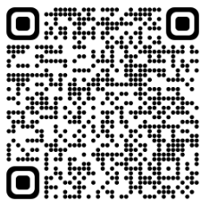
圍爐煮茶 QR CODE

可為各個團契、事工及小組提供泡茶服務，由泡茶師駐場現場泡茶，泡茶服務時間一般1.5-2小時。建議奉獻金額（圍爐煮茶成本約澳門元300/次），歡迎申請。