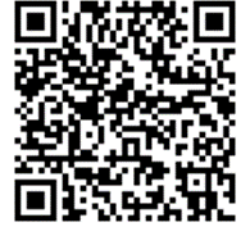
愛心工程 2023 年 11 月通訊