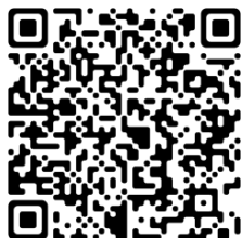
訂購茶葉 QR CODE

可為各個團契、事工及小組提供泡茶服務，由泡茶師駐場現場泡茶，泡茶服務時間一般 1.5-2 小時。建議奉獻金額（圍爐煮茶成本約澳門元 300/次），歡迎申請。