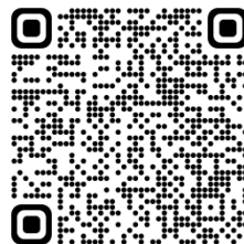
圍爐煮茶 QR CODE