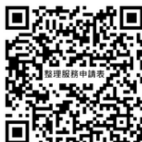
服務申請 QR code