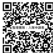
入隊申請 QR code