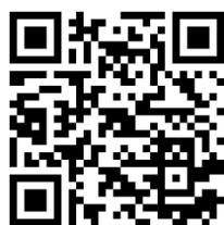
章程 QR code